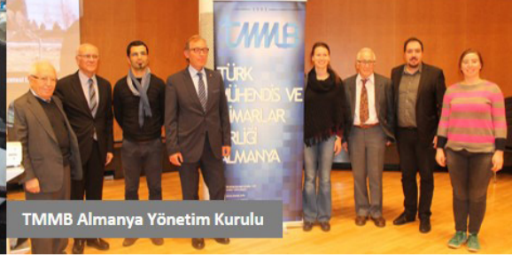
TMMB Almanya Yönetim Kurulu

TMMB yetkilileri, mühendislik ve bilimsel yaklaşımın “milliyetçi” olmadığını, bu nedenle yüksek nitelikli Türk göçmenlerin Almanya ve Türkiye arasındaki ilişkilerin geliştirilmesine büyük katkı sağlayabileceğini belirtti. Günümüzde bu faaliyetlerin daha ziyade bireysel girişimlerle gerçekleştirildiğini belirten yetkililer, uzun vadede fayda getirmesi için STK’ların birlikte çalışabileceği bir model olması gerektiğinin altını çizdiler.